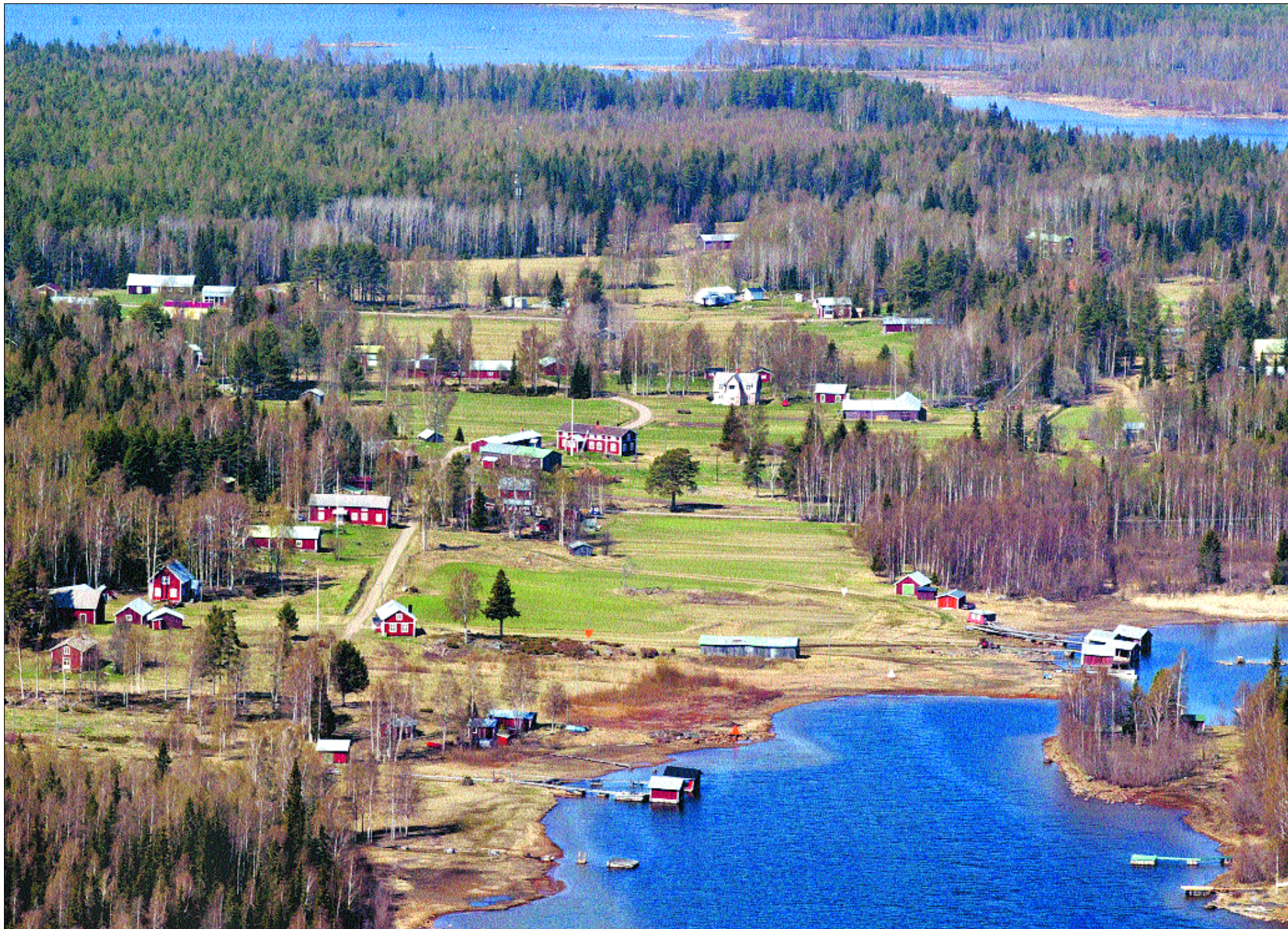
Hindersön är en grön och skön ö. Den är en jordbruksby, kringfluten av Bottenviken, nära havsbandet i Luleå skärgård. Ön erbjuder många väl skyddade hamnar. Här en vy över Ostisund och den centrala byn. I bakgrunden syns Hannusviken, Porrissundet och Lappön.

På 65 grader, 34 minuter nord och 22 grader, 35 minuter ost ligger Hindersön, tre mil öster om centrala Luleå. Det är en unik ö, fortfarande full av liv och med en kultur som är värd att bevara.