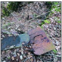
...lokomobilen i Norrisund. Sidan 22