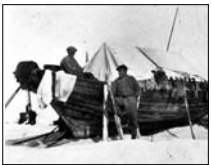
...jakten på säl – hård, men lönsam. Sidan 8