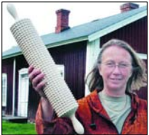
...bakningen förr och nu. Sidan 6