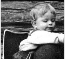
...Hindersön från ett annat perspektiv. Sidan 4