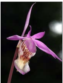
...faunan på Hindersön. Sidan 25