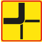
T15-2 Vägars fortsättning i korsning