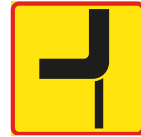
T15-4 Vägars fortsättning i korsning