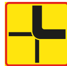
T15-1 Vägars fortsättning i korsning