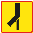
T15-6 Vägars fortsättning i korsning