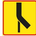
T15-5 Vägars fortsättning i korsning