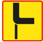
T15-3 Vägars fortsättning i korsning