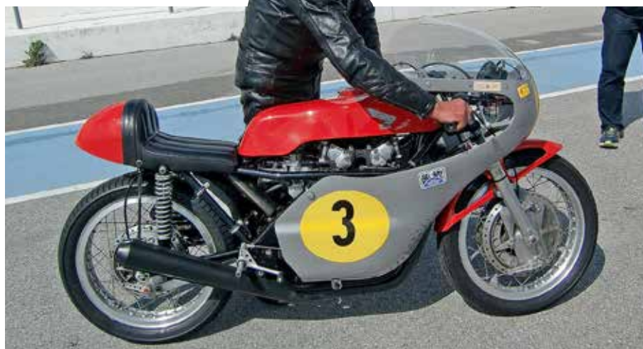
Börje "Borsch" varmkör sin Drixton Honda

Så här ser banprofilen ut - endast den övre bandelen ("Nordslingan") är dock klar