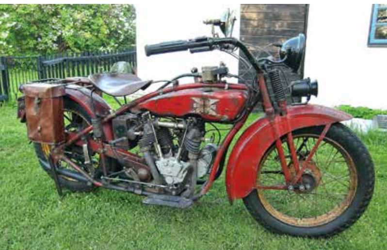
Runes Super X i välbevarat originalsckick