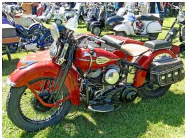
En härlig Harley-Davidson med vagn