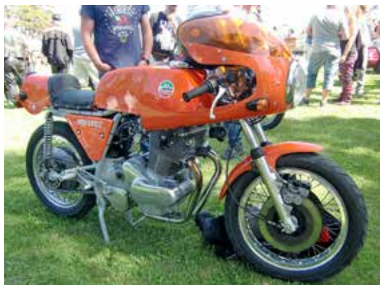
Laverda 900 SF2 C