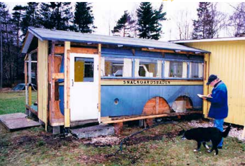
Här håller man på att frilägga busschassiet från sommarstugan