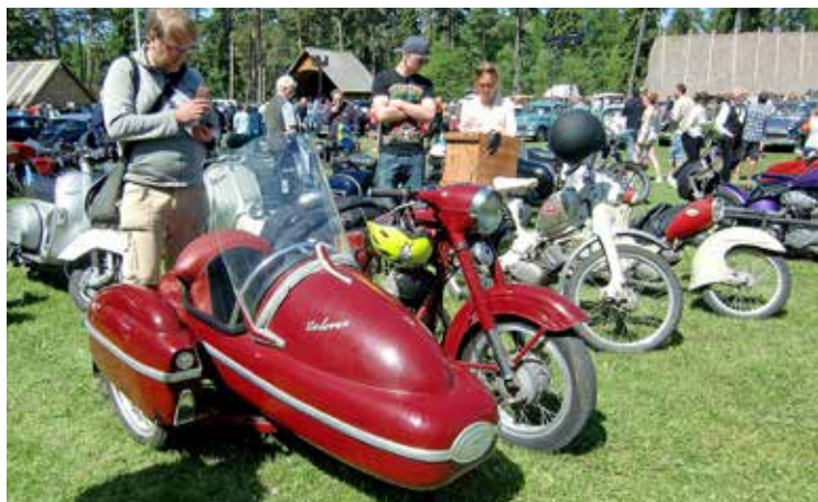
Jawa med Velorex sidvagn vid Lojsta slott