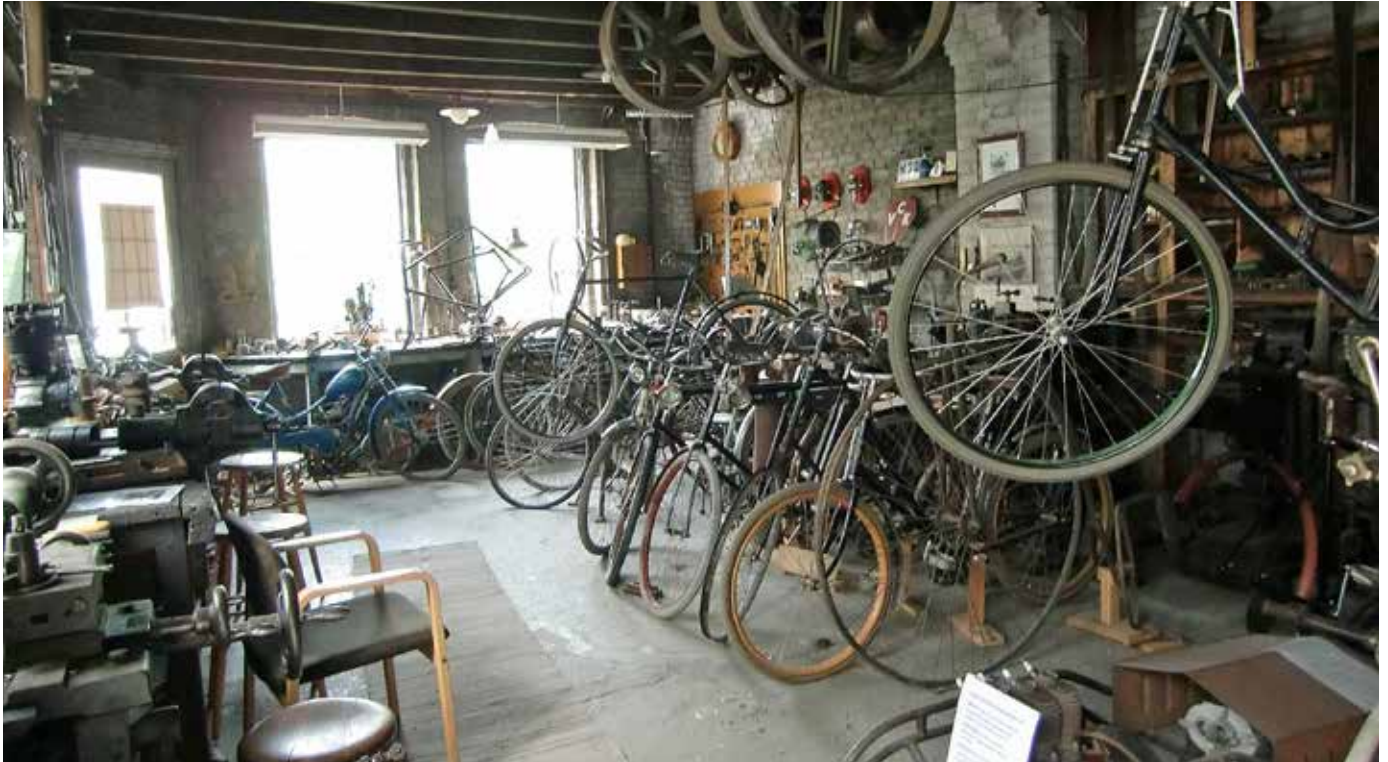
Wigströms velociped- och motorverkstad står alltjämt i stort sett orörd sedan 1910-talet (se MC Veteranen 4/2014)