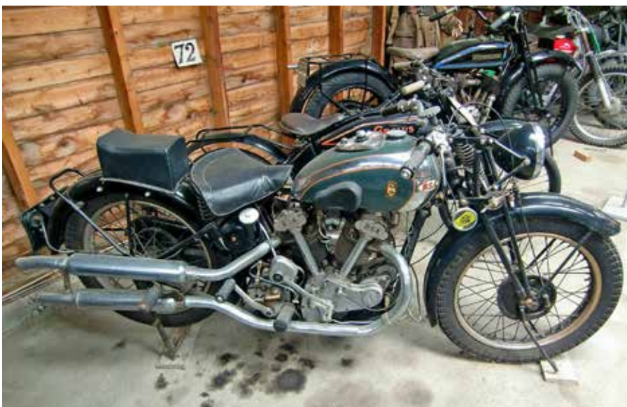
Muséets BSA J34-11 från mitten av 30-talet är bara en av de intressanta hojarna där