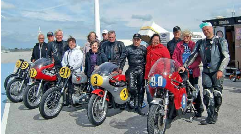
Hela gänget samlat på Gotland Ring