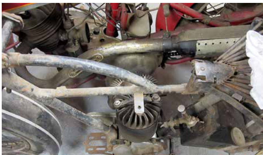
Senaste fynden, en AJS och en TWN S 350