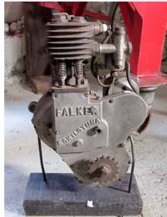
Falken från Eskilstuna - inte var dag man ser en sådan