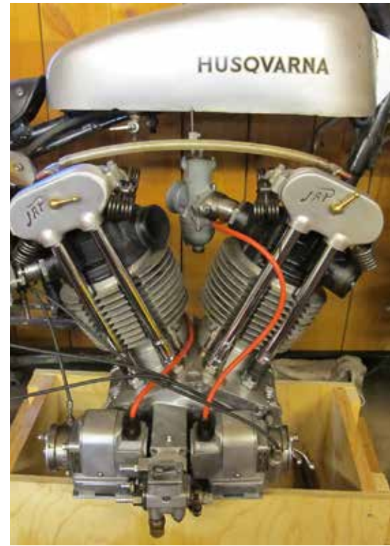
Kolossal JAP V-twin, får den verkligen rum i Husqvarna-ramen?