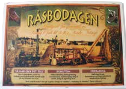
Annons för Råsbo-dagen

från tidigt 1920-tal. Den demonterades för länge sedan och några delar visade sig ha kommit på villovägar vid prov-