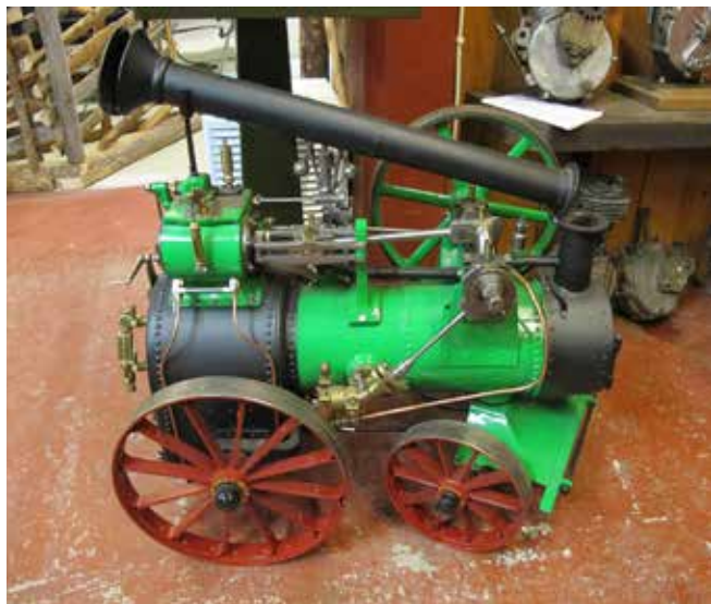
Lokomobil av det lite förkrympta slaget