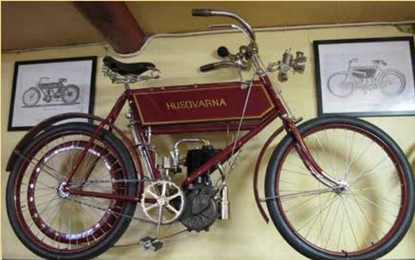
Ännu en NSU som säkert uppnått antik ålder