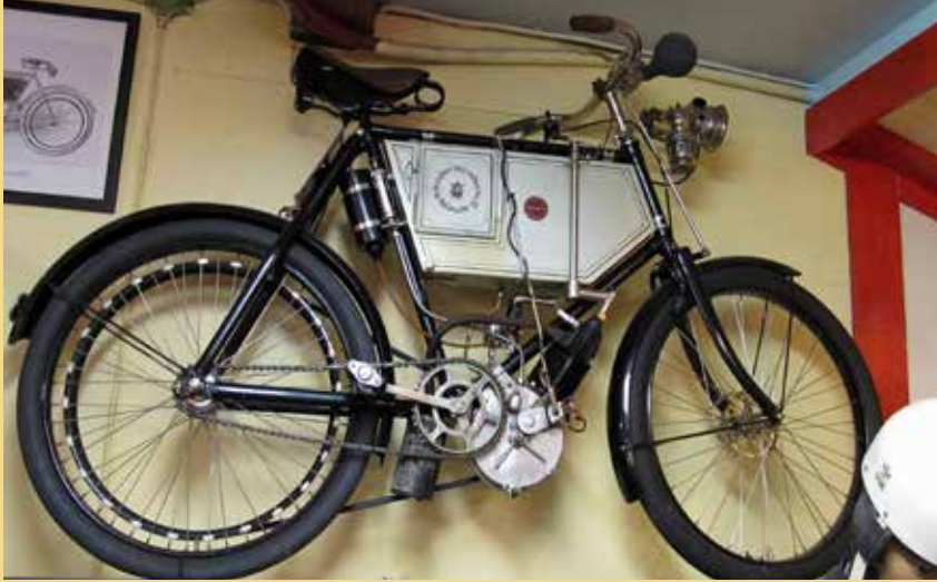
En tidig NSU, dock inte den äldsta maskinen på muséet