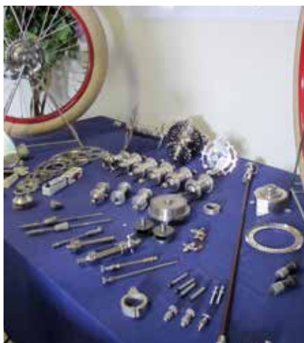
Vid entrén till muséet fanns ett urval av de delar som tillverkas