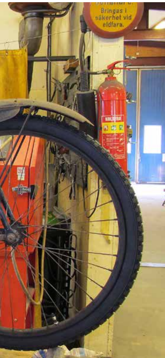
I entrén till verkstaden stod denna gamla NSU och väntade på omvårdnad