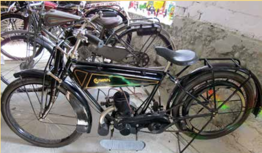
Calthorpe från 1920-talet