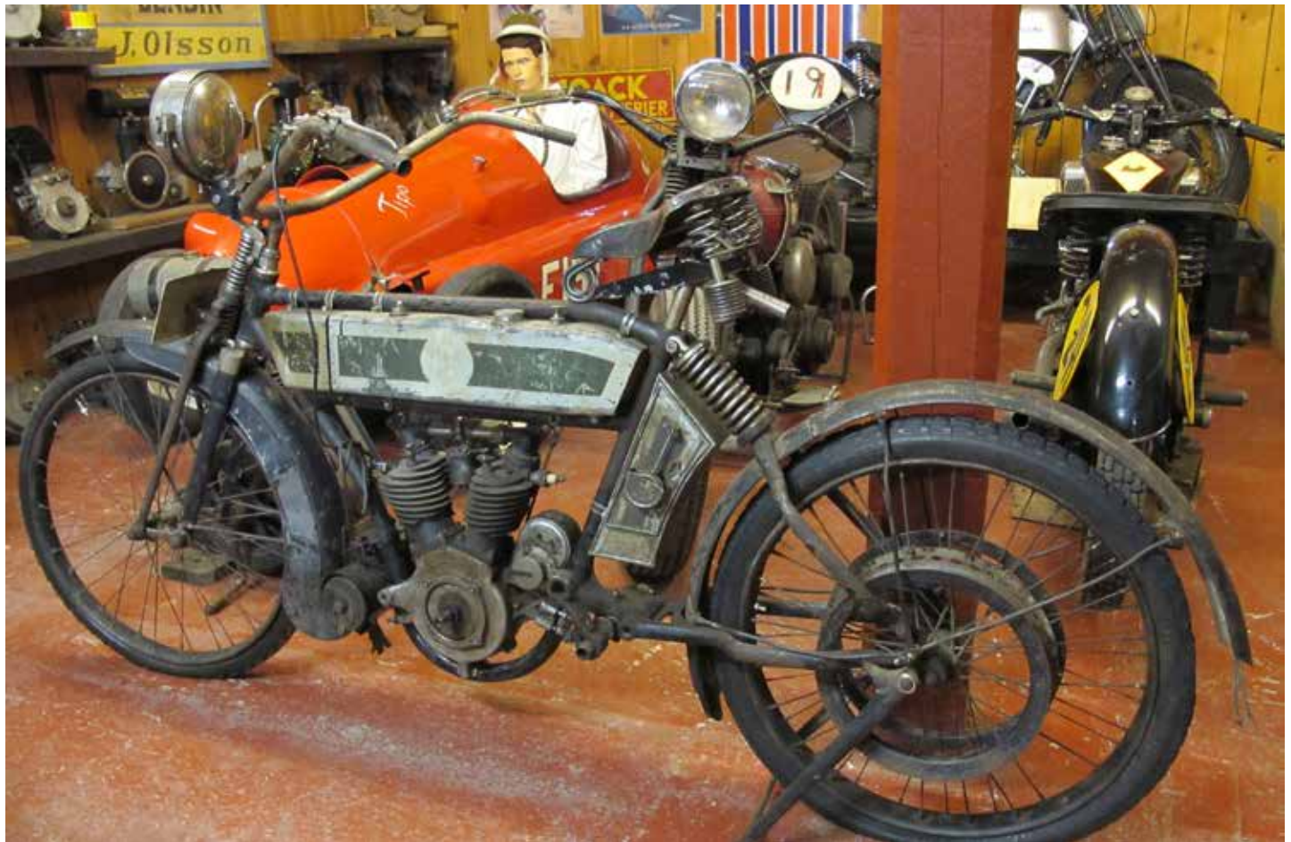
En av de första Husqvarna-motorcyklarna