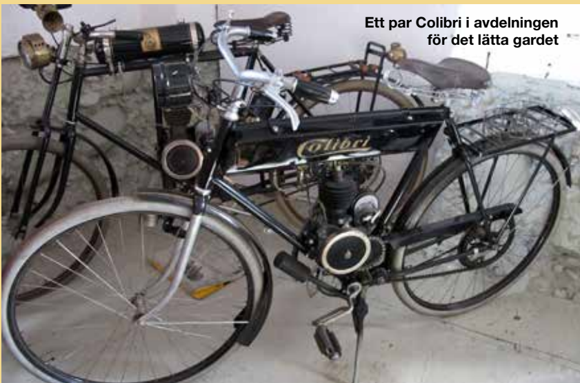
Ett par Colibri i avdelningen för det lätta gardet