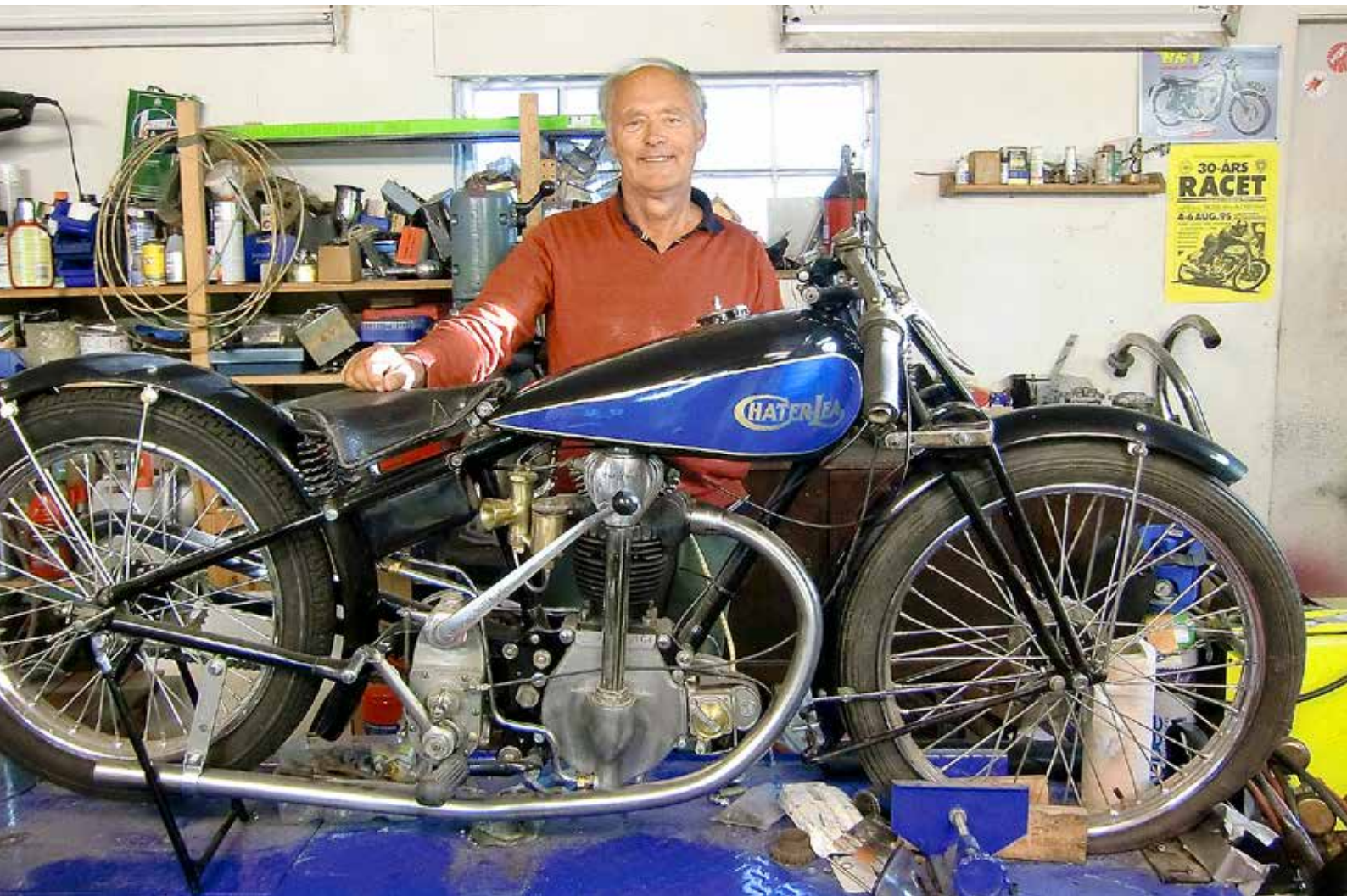
Chater-Lea sommaren 2017