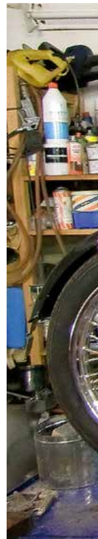
Gregger med sin C