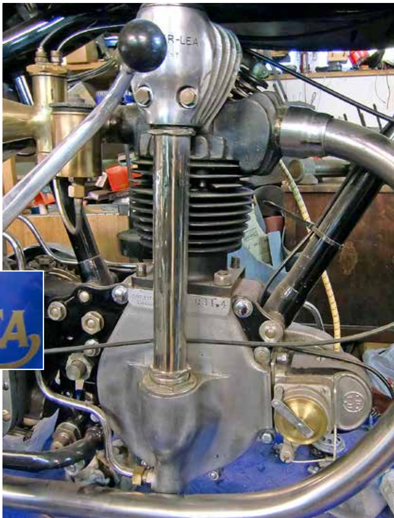
Närbild på face-cam-motorn