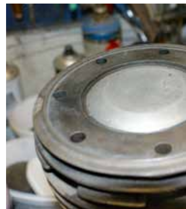
Fyra bilder från Greggers arbete med reoveringen av motordetaljer

Vimmerby. Nu återstår förnickling av nämnda rör och vissa andra delar samt injustering innan jag kan få lyssna till musiken från en face-cam-motor.