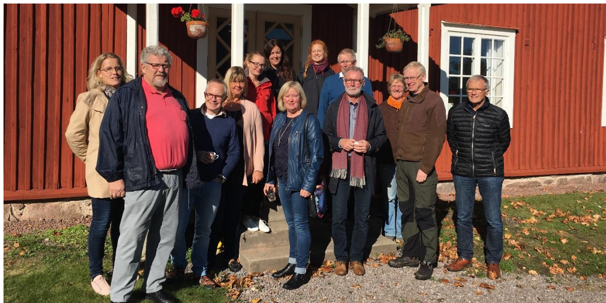
Representanter i Leader Nordvästra Skaraborgs LAG-grupp från ideell, privat och offentlig sektor.

Fredag 6 oktober 2017 prioriterade Leader Nordvästra Skaraborg fyra projekt som bidrar till lokalt ledd utveckling i vårt område. Denna beslutsomgång hade projekten inriktning på turism och att stärka det lokala samhället. Totalt stödbelopp för dessa fyra projekt är ca 2,6 miljoner och nu inväntas Jordbruksverkets formella beslut om projekten.