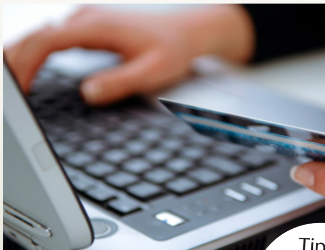
PTS EFTERLYSER SMARTA KOMMUNIKATIONS- LÖSNINGAR INOM E-HANDELSOMRÅDET.