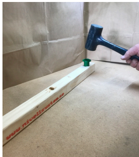
Slå i gänghylsan med gummiklubba.