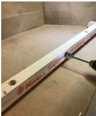
Borring av tvärställt hål för montering av gänghylsa och stöd mot vägg.