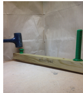
Ex. på montering av gänghylsa.