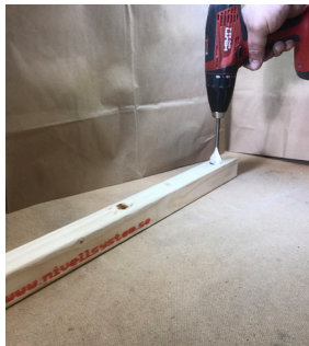
Borra hål med ett 26 mm borrar.

Vid kapning av Nivell golvregel kan man behöva borra ett nytt hål med en 26 mm borrartr. 420, 430 och slå i gänghylsan med en gummiklubba. Hålet ska borraras minst 50 mm från regeländan.