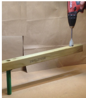
Här ihop med Nivells utegolv.