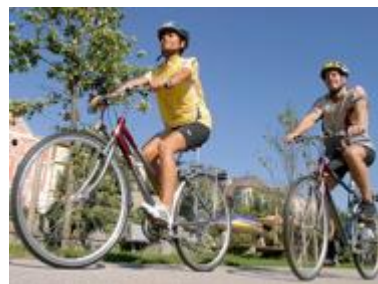
Unisex cykel, 7- eller 21 växlade

OBS! För att få rätt cyklar behöver vi också veta er längd. Meddela detta vid bokningstillfället. Ta med egen hjälm och säkerhetsväst, rekommenderas.