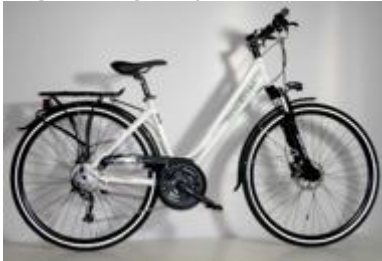
Unisex cykel 7-eller 21 växlad

OBS! För att få rätt cyklar behöver vi veta er längd. Meddela detta vid bokningstillfället. Tag med egen hjälm! Det är inte hjälmtvång, men vi rekommenderar detta för er säkerhet.