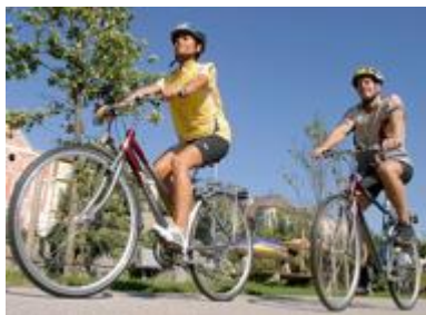
Unisex cykel, 7- eller 21 växlad.