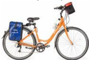
Unisex cykel 27 växlar

OBS! För att få rätt cyklar behöver vi veta er längd. Meddela detta vid bokningstillfället.