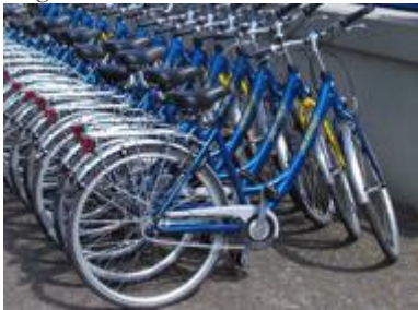
Unisex cyklar 7-växlade

Tag med hjälm, solhatt och regnkläder. Packa i en mjuk resväska, då utrymmet i hytten är begränsat.