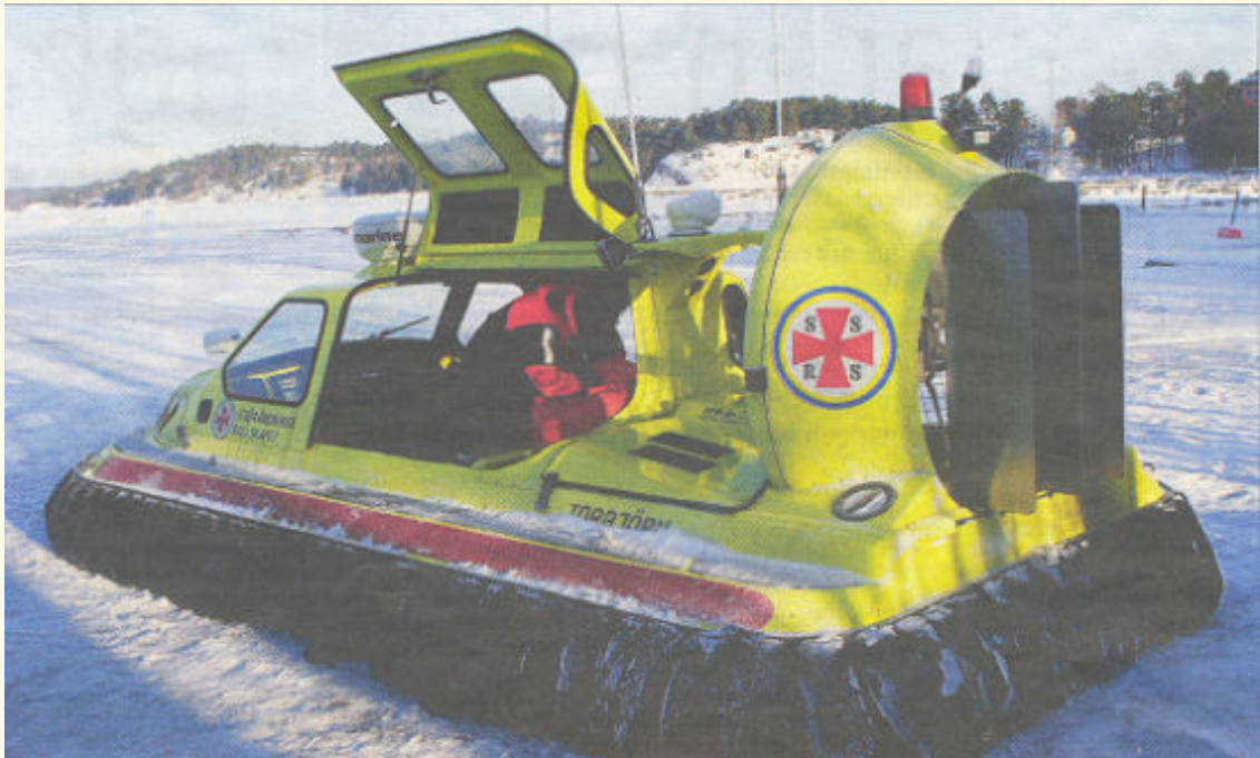
Utan snö på isen har svävaren en maxfart på 60 knop och marschfarten ligger runt 30 knop.