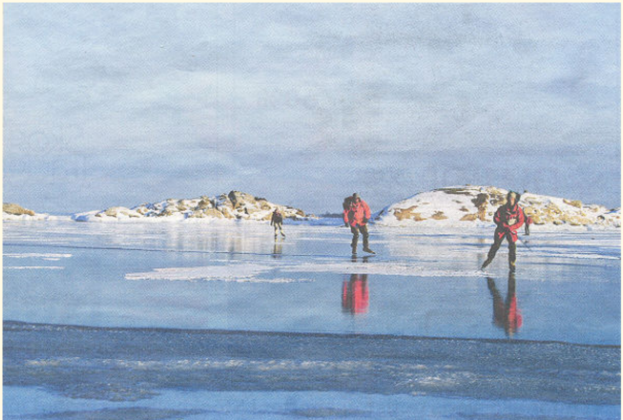
På nyfrusen kärnis går det lätt att åka långfärdsskridskor men det gäller att vara försiktig, isen är lika farlig som vacker.

Tipsa gärna om nyheter eller något som ni vill uppmärksamma här på DALARÖ-JOURNALEN