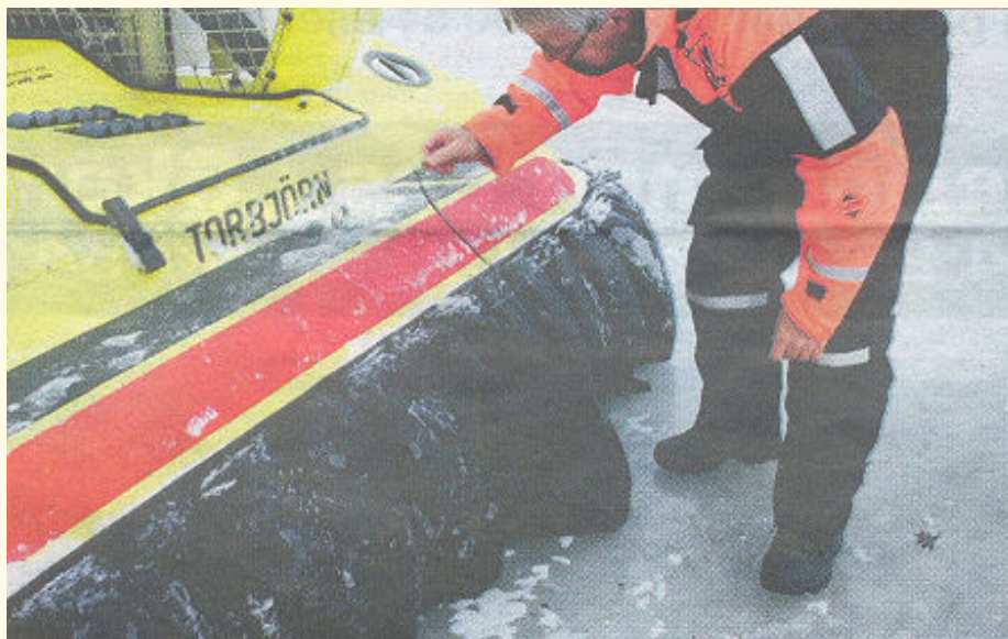
En av Torbjörns kjolar har lossnat vilket är vanligt vid körning över rännor och ojämn is.

Ovanstående text och bild är hämtat ur tidningen Skärgården.