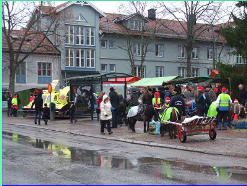
Vid Dalarö Torg var kommersen hög