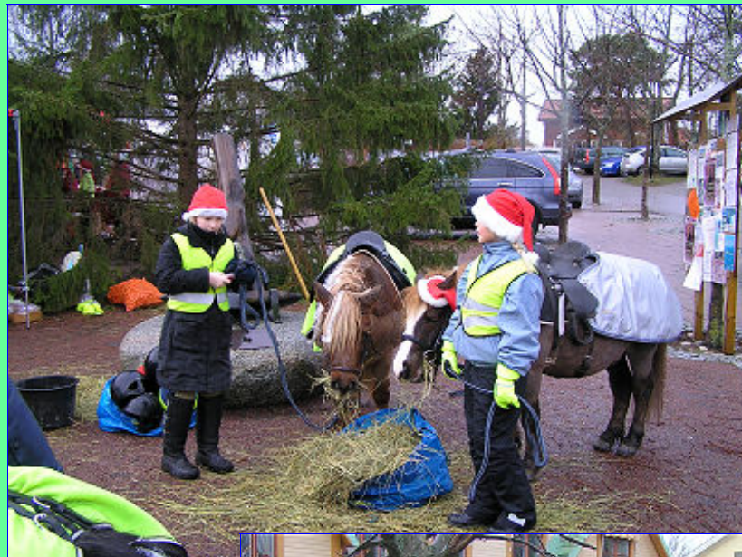
Ponnyridning för barnen vid Dalarö Torg.