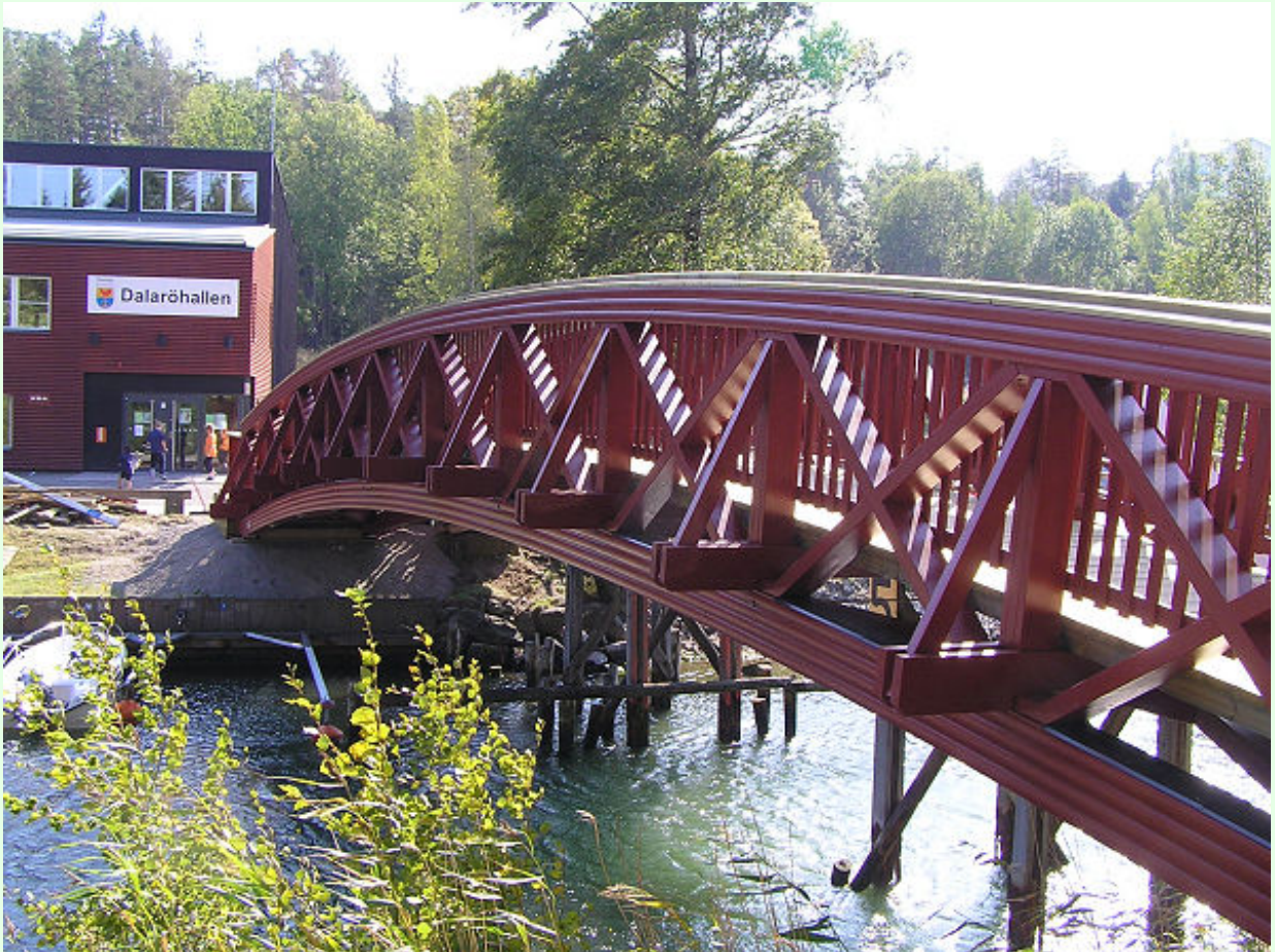
Den nya gångbron matchar Dalaröhallen färgmässigt.