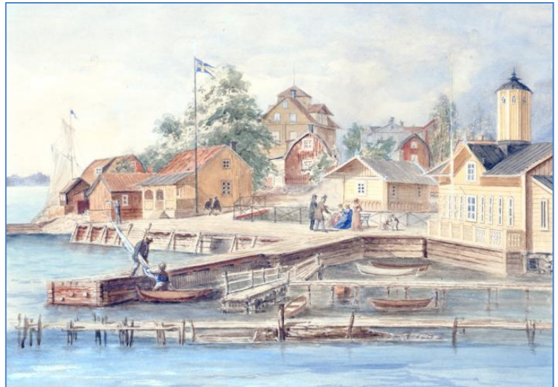
Fiskarhamnen med lotsvakthuset och tulluppsyningsstugan Dalarö. Målning av C.V. Blom 1879. Fotograf okänd.