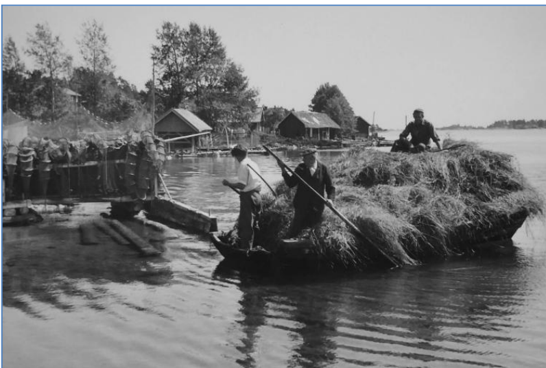
Höllass på lanka visar hur skördarbetet kunde gå till i skärgården.