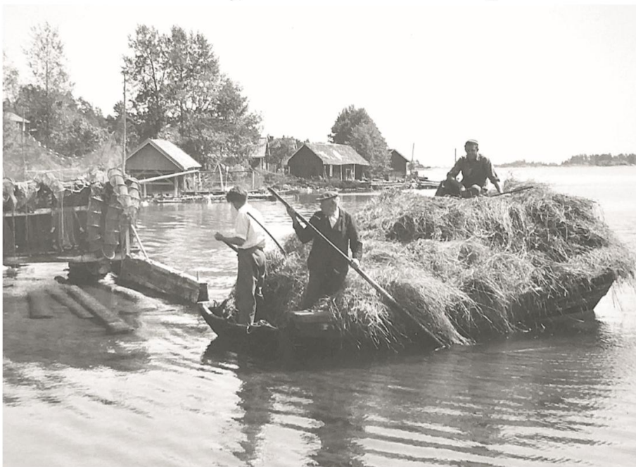
Lankan med hölasset speglar mycket väl hur en del av skördarbetet gick till ute på öarna.

Boken är rikligt bildsatt med såväl fotografier som kartor och illustrationer från museer, böcker och porträttsamlingar. Bilagorna med persongalleri, ägarförteckningar och efterförklaringar ger välbehövligt stöd till läsningen. I slutet av boken finns även ett urval av de faktiska dagboksanteckningarna förda av Anders Berg, vilket är spännande och under-