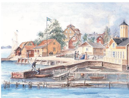
Nuvarande Fiskarhamnen i Dalarö var under det tidiga 1800-talet platsen i Tullbacken där lotsutkik och tulluppsyning fanns. Konstnären är okänd, fotografen av målningen likaså, men målningen är gjord i slutet av 1800-talet.

hållande läsning, det känslofattiga språket till trots.