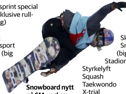
Snowboard nytt på SM-veckan.