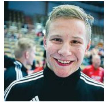
Åkte ut direkt.

BK Flash och Boden hålls som seriefavoriter i Nordallsvenskan. TOMAS RUUTH