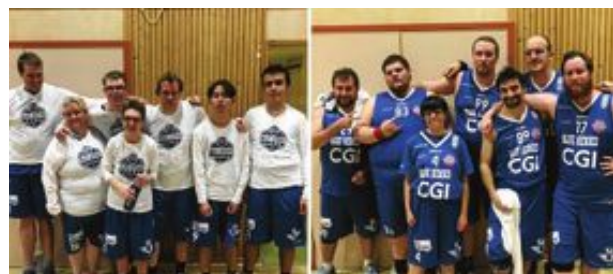
Blue Heroes båda lag i årets upplaga av Basketligan Special.

Lag 1 vann sin första match med stabila 44–7 och