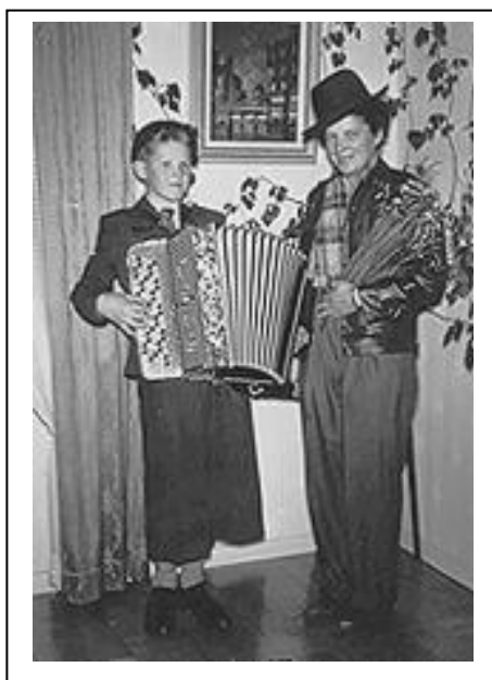
"Bildern" Jag spelar på en soaré 1958

När jag var 13 år så sa min ene farbror när spelmanslaget skulle spela till dans vid ett tillfälle att låt pojken följa med, oj vad spännande det var, jag hade lärt mig lite om harmonier så jag klarade mig rätt bra på det viset.