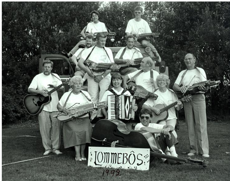
Lommebôs 1990, vi lånade en gammal brandbil och åkte till Danmark med.

Vi samarbetar och träffas nästan varje år, vi har varit Scotland 4 gånger tror jag, och det fortsätter, detta året skall vi till Sunne i Värmland.