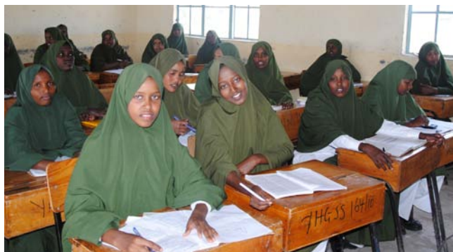
Många av våra gymnasieflickor går på NEP School, Garissa.

Idag är det 29 flickor som läser på gymnasiet, varav 10 flickor började första året i januari. När det är dags för gymnasiet går de på internatskola antingen i Garissa eller i utkanten av Nairobi. För att bekosta flickornas