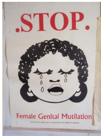
En lokal affisch i kampen mot könsstämpning.

Stiftelsen utökar och sponsrar nu tre manliga fotbollslag i Garissa mot att de sprider ordet om att sluta med könsstämpning. Dessa män är emot ingreppet på kvinnan.