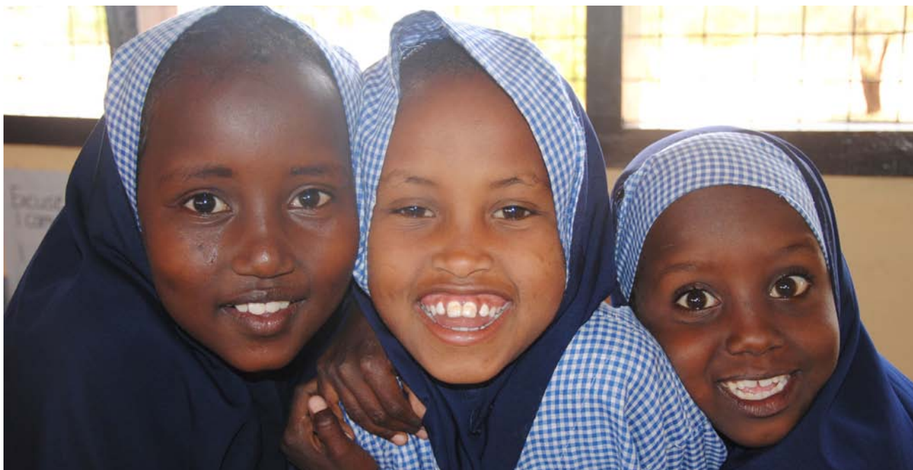
Tre glada flickor i sina nya skoluniformer.