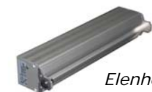
Elenhet, artikelnummer 15 m 16-7260-10 25 m 16-7260-20 35 m 16-7260-30