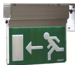
Armatur med vinkelfäste