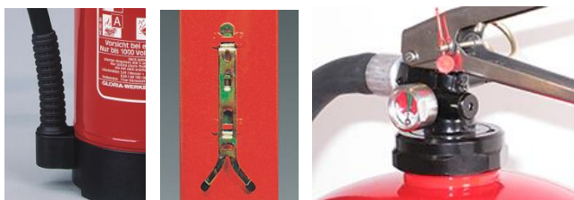
Plastfot med slangfäste