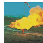
C - Gaser t.ex stadsgas, gasol