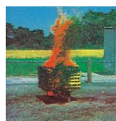
A - Fibrösa material som trä, tyg och papper

Släckaren kan användas mot elektrisk utrustning eftersom släckmedlet inte leder ström. Pulversläckarna är köldbästandiga och kan vara placerade utomhus även vintertid.