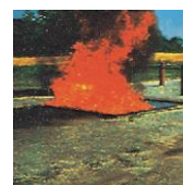
B - Vätskor och bensin och olja