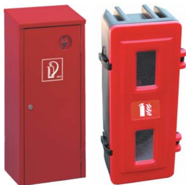
Plåtsåp med nyckellås