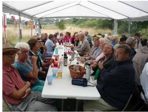
Fika under kort regnpaus

Tisdagen - mörka hotfulla moln när man tittade ut på morgonen, häftigt regn och åska som visserligen upphörde efter en stund. Några timmar kvar till dagens parspel klockan 13 där 18 par förväntas ställa upp med spel från båda kortsidorna.