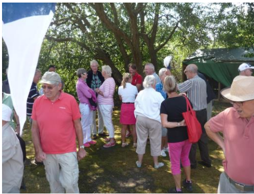
Viss nervositet inför spelstarten