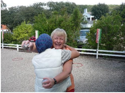
Lyckliga pristagare på tisdagen