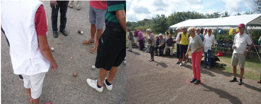
Vem är närmast?