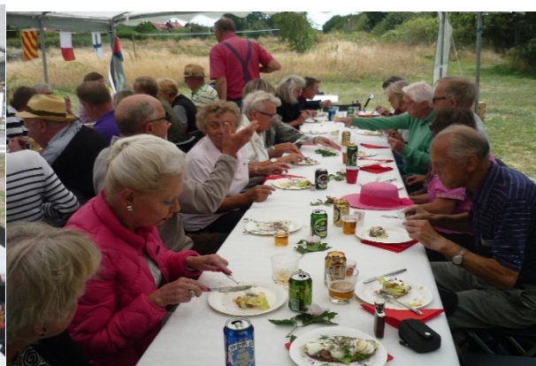
Sillamackan satt fint innan spelet startade