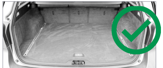
Bagasjerom uten skritt fungerer godt når du laster med en gaffeltruck.