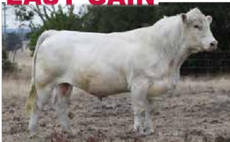
WELCOME SWALLOW EASY GAIN F508 (AI) (ET) (P)