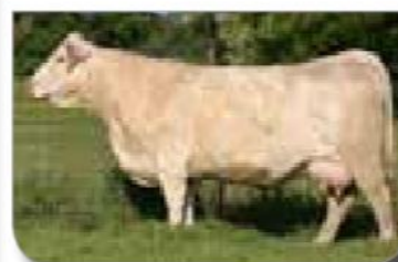
Grand dam - LT Unlimited Maid 7184 as a 10 y.o.