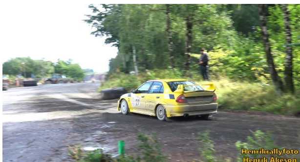
Bengt Bengtsson, SMK Hörby, gjorde en riktig kanontävling och blev 5:a totalt.