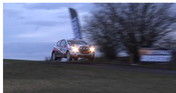
Bitvis var det väldigt snabbt.