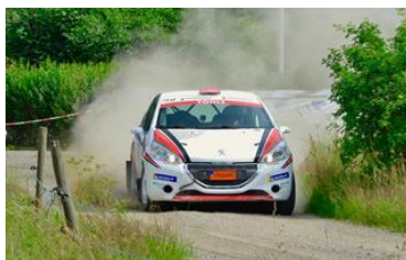
Peugeot 208 R2