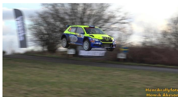
Philip Geipel flög längst med sin Skoda Fabia R5.