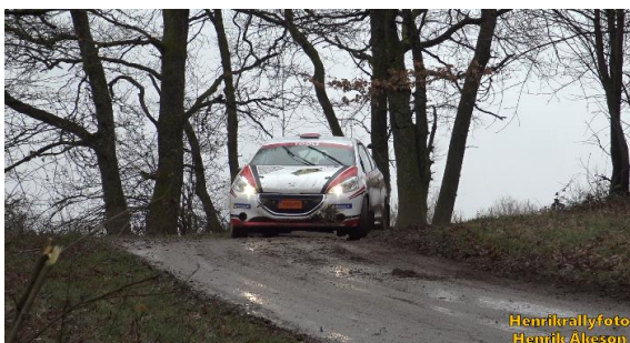
Vägarna var överlag hala och svårkörda.