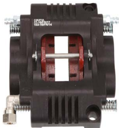
Etriers / Calipers