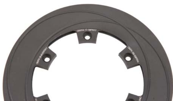
Disques / Discs