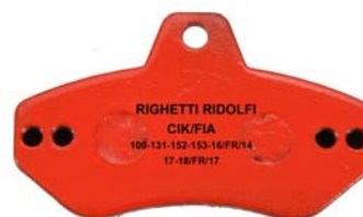
Plaquettes / Pads