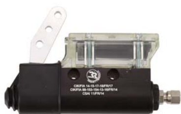
Maître-cylindre / Master-cylinder