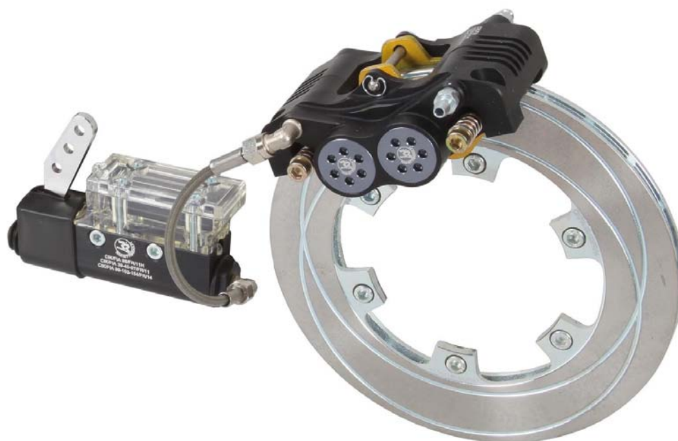
PHOTO VUE DE DESSUS DU SYSTÈME COMPLET ASSEMBLÉ

This Homologation Form reproduces descriptions, illustrations and dimensions of the brake system at the moment of the CIK-FIA homologation. The Manufacturer may modify them, but only within the limits set by the CIK-FIA Regulations in force.