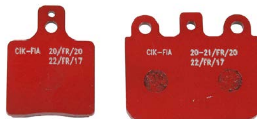
Plaquettes / Pads