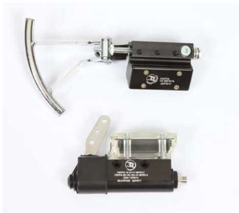
Maître-cylindre / Master-cylinder