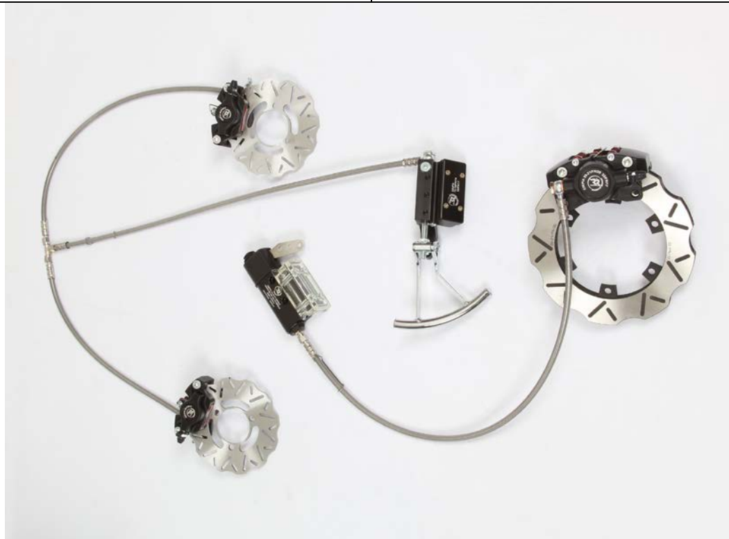
PHOTO VUE DE DESSUS DU SYSTÈME COMPLET ASSEMBLÉ PHOTO FROM ABOVE OF COMPLETE ASSEMBLED SYSTEM

This Homologation Form reproduces descriptions, illustrations and dimensions of the brake system at the moment of the CIK-FIA homologation. The Manufacturer may modify them, but only within the limits set by the CIK-FIA Regulations in force.