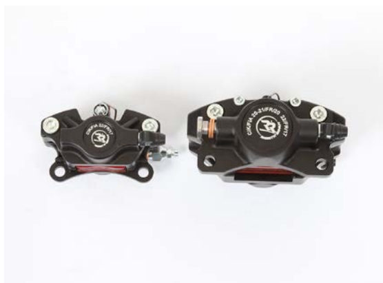
Etriers / Calipers