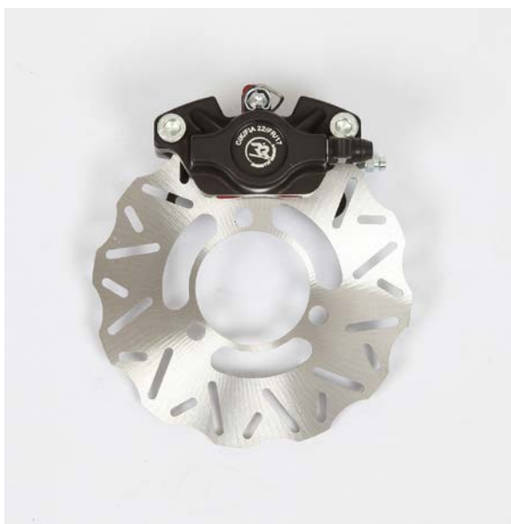
Photo du frein avant : étriers et disques seulement Photo of front brake: calipers and discs only