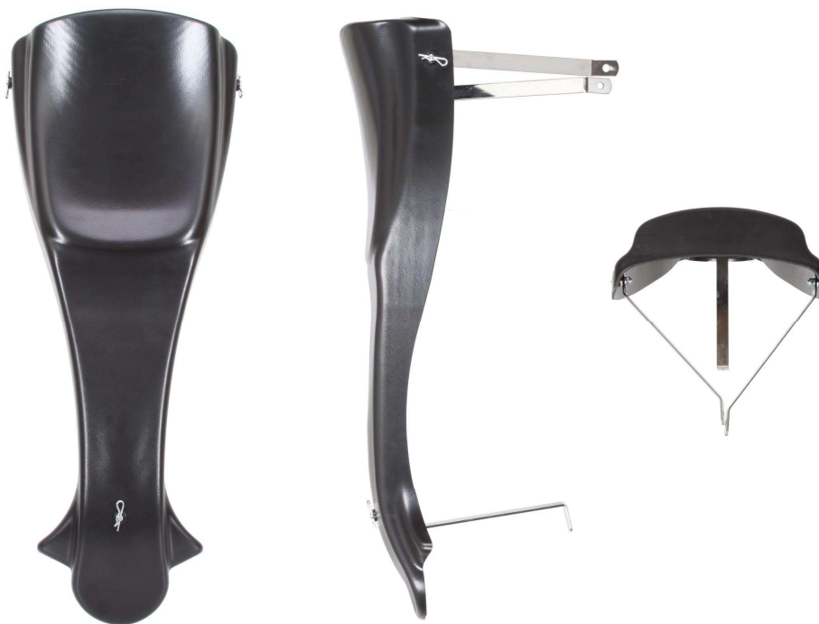
PHOTOS VUE DE DEVANT, DE DESSUS ET DE COTÉ, DU PANNEAU FRONTAL ET SUPPORTS PHOTO FROM FRONT, ABOVE AND SIDE OF FRONT PANEL WITH SUPPORTS

This Homologation Form reproduces descriptions, illustrations and dimensions at the moment of the CIK-FIA homologation.