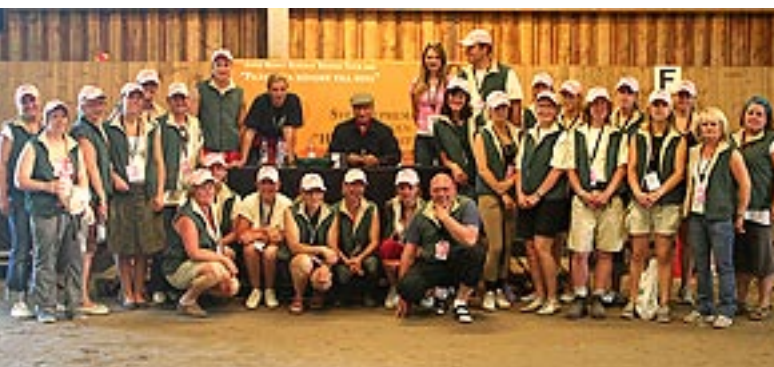
Alla funktionärena på Almare Stäket!!

Efter en Demonstration är vi alla uppe i varv! Goa, trötta och glada. Hungriga som vargar och lätt snurriga av det enorma tempot vi haft de senaste 24 timmarna. Hjärnan kan bara ta emot mycket korta meningar vid detta laget! När allt är packat, städad och hästarna åkt hem tar vi oss tillbaka till hotellet och kör en "After Horse" med genomgång vad vi lärt oss denna gång och vad vi kan göra bättre nästa gång. Alla skriver på konvolutet, vi kramar och gratulerar varandra sen dråsar vi i säng!