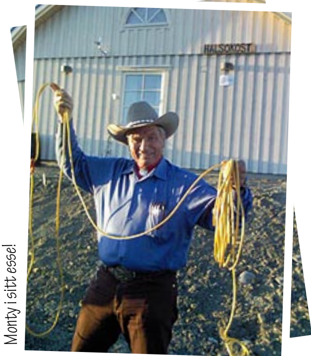
Monty i sitt esse!