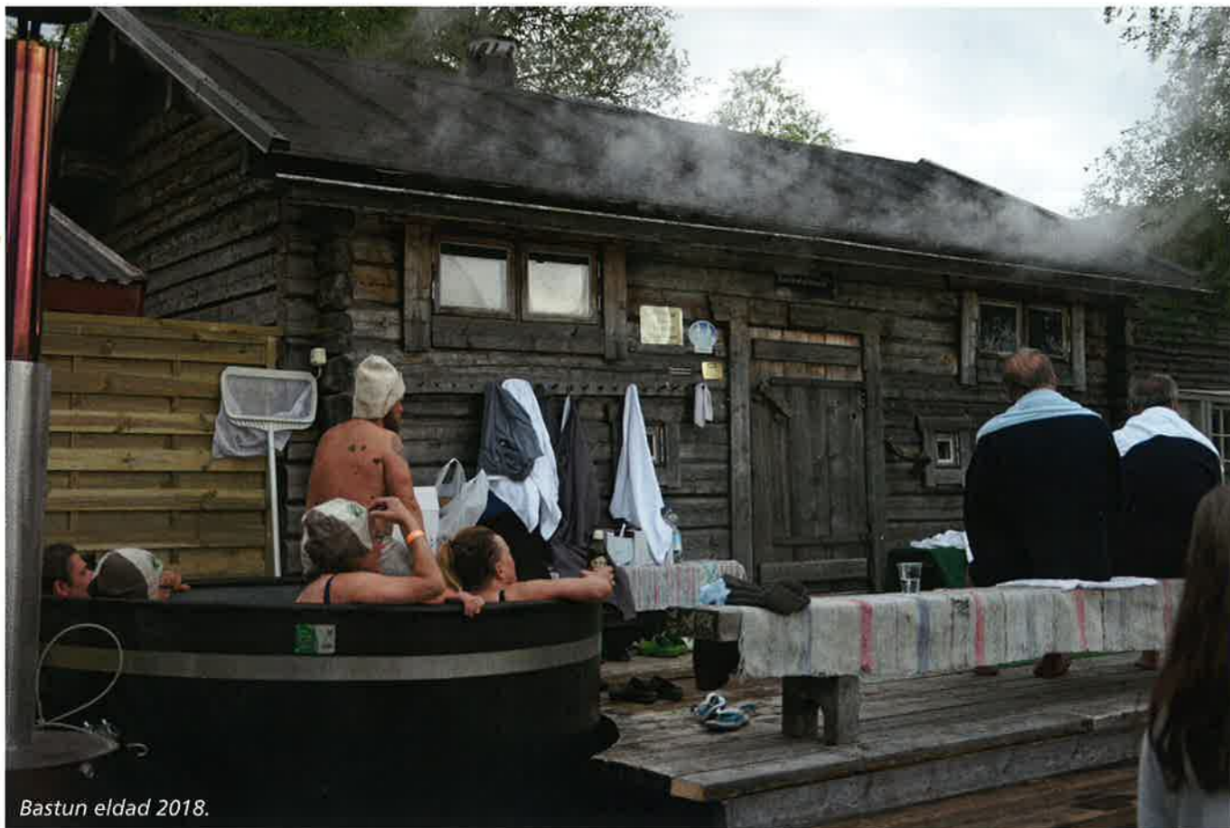
Bastun eldad 2018.