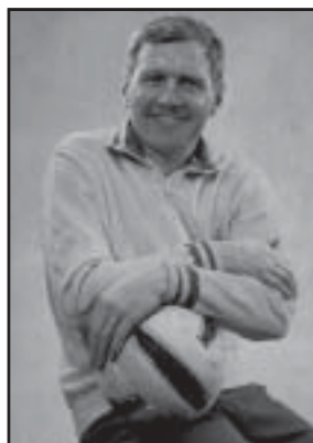
Orvar Bergmark från Byske spelade 94 landskamper i fotboll.

Orvar Bergmark växte upp i Byske, där hans pappa jobbade som bagare. Det var också i Byske som Orvars intresse för idrott väcktes. Den allra första framgången fick han som skidåkare! Orvar skulle åka en skoltävling, men när han vandrade till skolan med sina skidor på axeln, blev han plötsligt nervös. Så nervös att han helt enkelt backade ur och vände hem igen, där pappan undrade vad som hänt? Orvar sa som det var, att han inte vågade tävla – men pappan kunde konsten att lirka med sin son, han fick Orvar att förstå att man åtminstone måste starta innan man kan ge upp. Det var ord som tog intryck, Orvar lydde sin far, han återvände till tävlingen, startade – och vann!