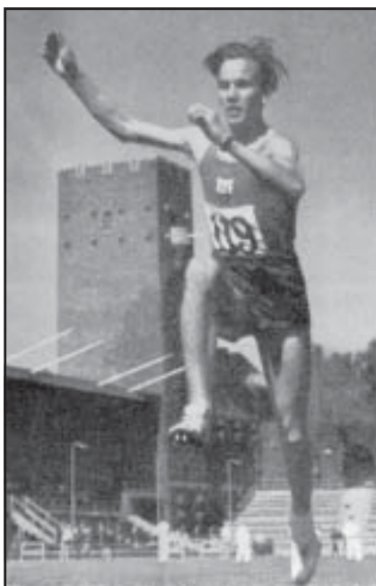
Arne Åhman på Stockholms stadion 1949

Åhmans idrottsintresse väcktes hemma i Nordingrå genom att lyssna på radioreferaten från Berlinolympiaden 1936 och då som elvaåring bestämde sig för: jag skall också stå på en olympisk prisvall ! Han tränade hopp med smärtingskor hemma på gården, och det dröjde inte länge innan han fick vara med i höjdhopp i en klubbmatch mot Brännan i Härnösand. Där fick han för första gången prova att använda spikskor och höjde sitt personrekord med 20 centimeter. Utvecklingen gick vidare med tränarkontakter och kursdeltagande, vilket bl. a ledde till att en del idrottsplatser i Ångermanland fick flytta hopplankan bakåt för att han inte skulle hamna utanför hoppgropan.