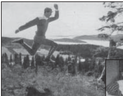
Spänsträning i vacker omgivning.