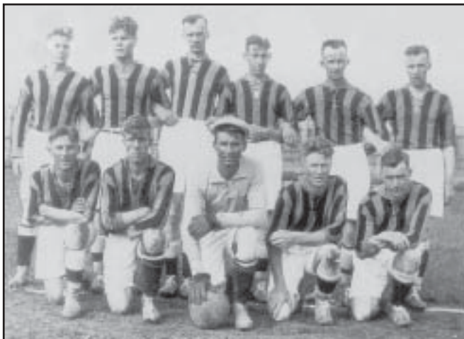
Norrbyskärs fotbollslag 1929

Halvtidsresultatet stod sig matchen ut, och banade väg för en förnämlig andra-placering i serien för Hörnefors efter suveräna Domsjö IF, medan Norrbyskär hamnade allra sist.