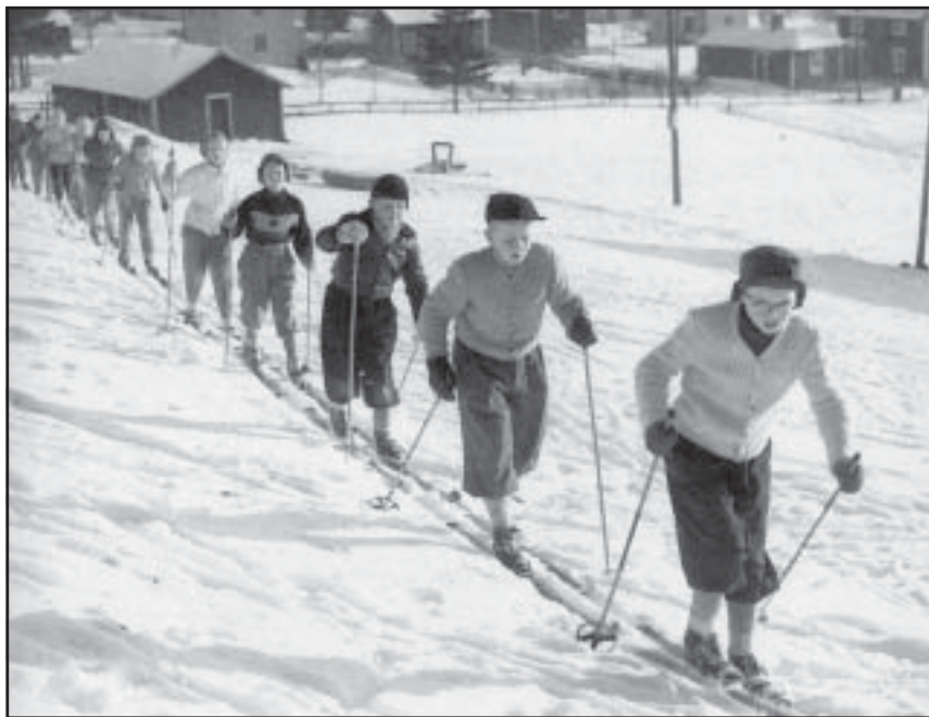
Under 1940- och 1950-talet bildades många skolidrottsföreningar i länet. Här Folkskolan i Skellefteå på skidutflykt.