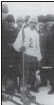
Gustav "Husum" Jonsen, en av våra främsta skidlöpare i skarven mellan 1920/30-talet.