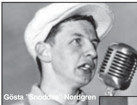
Gösta "Snoddas" Nordgren

"Snoddas" började sin sångkarriär med att sjunga "Flottarkärlek" i radio-programmet "Karusellen", det var 1952 och kvällen före SM-finalen i bandy mellan Bollnäs och Edsbyn. "Snoddas" radioframträdande blev inledningen på ett stort stycke svensk nöjeshistoria!. Landet drabbades av "Snoddas-feber" och "Flottarkärlek" toppade listorna under 13 veckor. I folkparkerna slogs publikrekord efter publikrekord där Snoddas drog fram. Som bandyspelare vann Snoddas två SM-guld för sitt Bollnäs, 1951 och 1956. Det blev m a o inget SM-guld dagen efter kvällen i Karusellen 1952. Då vann Edsbyn.