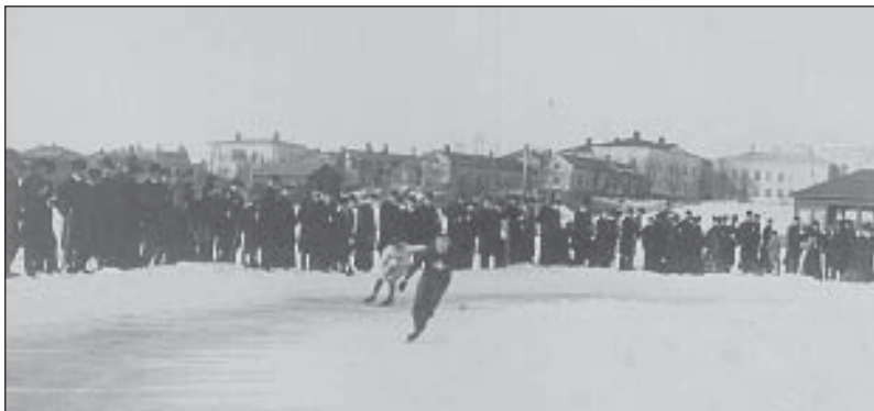
Isbanan på älven vid 1900-talets början.