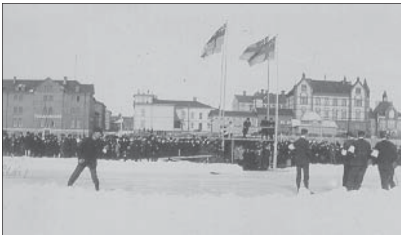
Isbanan på älven nedanför Stora Hotellet troligen 1904.

Konståkning fanns med på programmet då IFK Umeå bildades 1901. 1 JDM-tecken 1958 av Åke Öberg. 1962 försvann konståkning från IFK Umeås program.