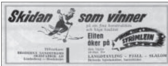
Annons ur "Sporten i dag" 1959-60

Hörnefors Sportklubbns historia blev inte lång, utan samhällets förskjutning från Bruket och ner mot kusten och nya befolkningsgrupper efter sufatfabrikens tillkomst 1906 kom att innebära slutet för klubben, som år 1908 ersattes av Hörnefors Idrottsförening.