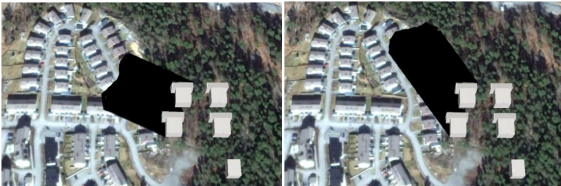
September kl 08.00

Dessa drygt 15 meter höga hus skulle på allvar inkräkta på många boendes möjlighet att använda sina altaner och kraftigt försämra ljusförhållanden och utsikt. Insynen i vissa hus skulle vara påtaglig. Trafiken på Charlottendalsvägen skulle öka avsevärt. Nedan en mycket preliminär "solstudie": *