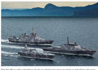
Det blir flera olika storlekar på de nya fartygen men mycket av tekniken går igen