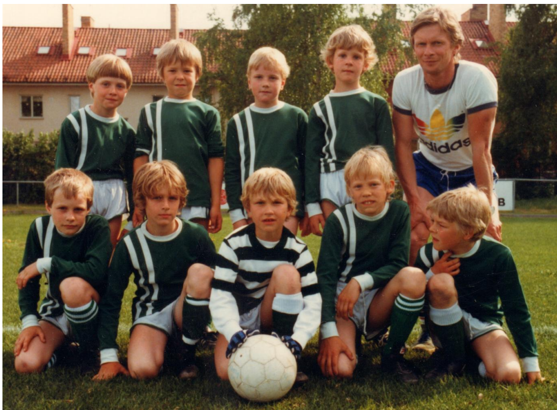
MT-Cupen 1984 Pojkar födda 1975-76. Detta är det ena laget av två stycken.