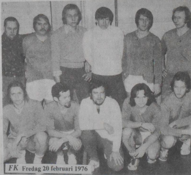
FK Fredag 20 februari 1976