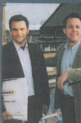
De bygger en stark företagskultur