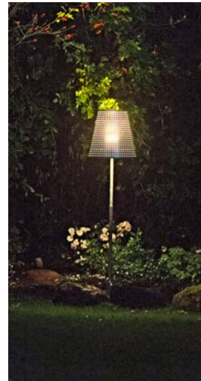
Utomhusbelysning av olika slag är ett bra sätt att hålla tjuven borta.

sin bil på din uppfart när du är bortrest.