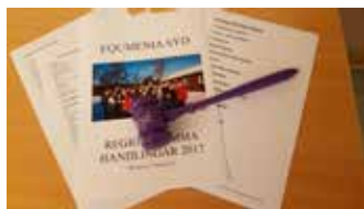
En del formalia men också engagerade samtal i bikupor