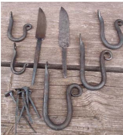
Några av de alster vi tillverkade under smideskursen.