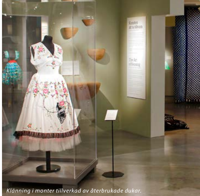
Klänning i monter tillverkad av återbrukade dukar.