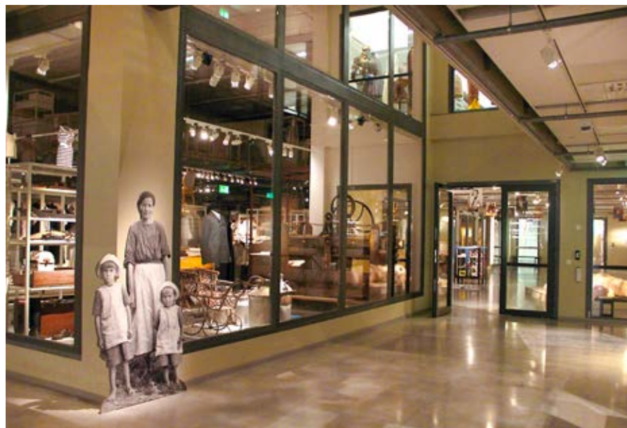
"Berättande magasin" på Sörmlands museum.

Som besökare kan du också boka tid för att få komma och titta på föremål eller arkivmaterial i våra samlingar som du är speciellt intresserad av. Det kan vara textilier, möbler, fotografier eller vad som helst. Så varför inte ta chansen att i