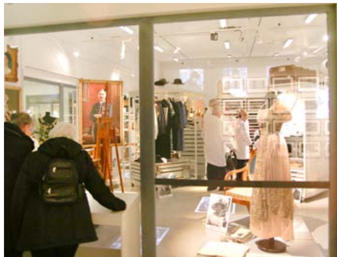
"Berättande magasin" på Sormlands museum.

TEXT: KARIN EDLUND, ANNY LIIVAMÄE