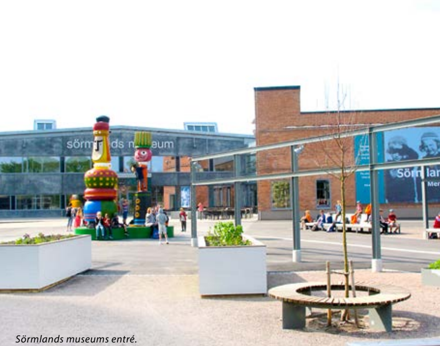
Sörmlands museums entré.