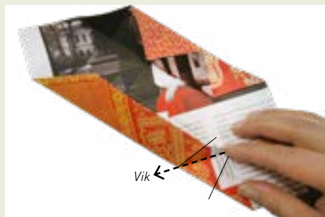
5: Nu kommer det klurigaste. Vikningarna har bildat en liten kvadrat (förtydligad med hela linjer). Den ska vikas in med ett diagonalt veck (streckad linje på bilden).