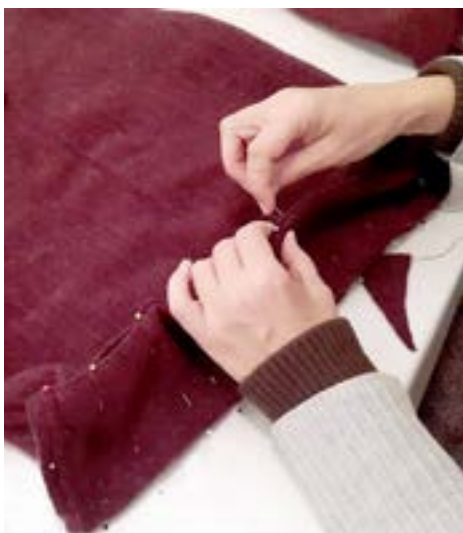
En ylletröja som tovats i tvättmaskin kan enkelt göras om till en väska, eftersom garnet då inte repas upp när man klipper i den.