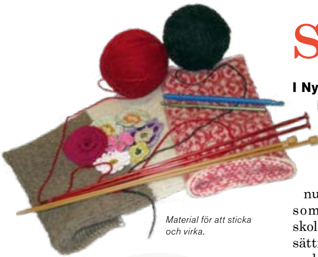
Material för att sticka och virka.