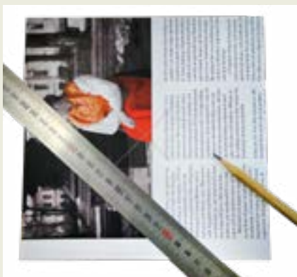
1: Börja med att märka ut mitten på ett fyrkantigt papper.