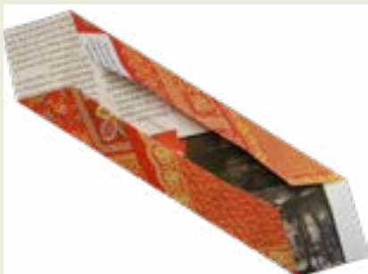
4: Vik ut två motstående hörn.