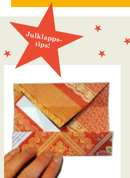
3: Vik in alla fyra långsidorna mot mitten, en i taget.