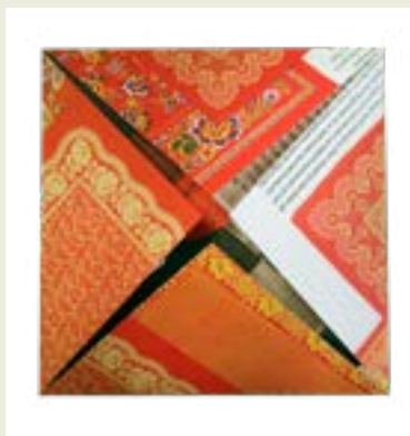
2: Vik in alla fyra hörn mot mitten.