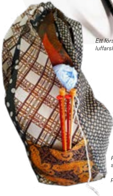
Pappas gamla slipsar blev en perfekt projektpåse.