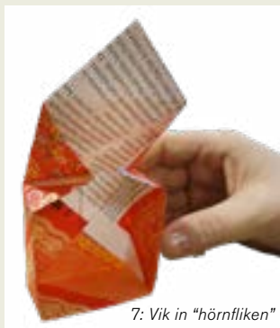
7: Vik in "hörnfliken"