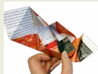
6: Detta görs på båda sidorna i båda ändarna.