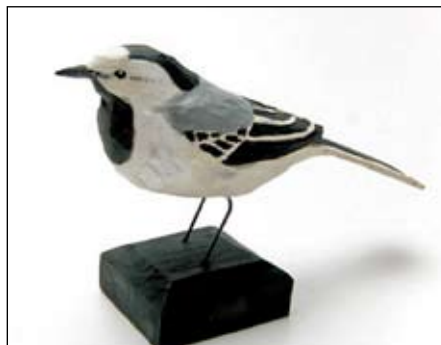
Sädesärla av Nicke Helldorff.

Av broderiets traditionella stygn, mönster, material och uttryck inspireras vi till egna tolkningar. Gå på upptäcktsfärd bland trådar, tyger och stygn. Lärare: Elisabet Jansson, Frövi, konsthantverkare och BRAK-medlem Tid: 19-20 november Plats: Gäldstugan, Nyköping Pris: 900:-, medl/ungd 700:- Anmälan – Senast 2 november